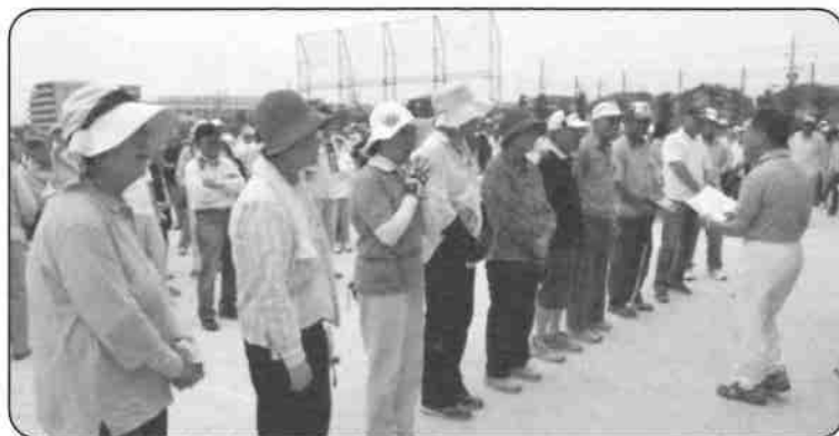
上位入賞者男女各5名の表彰式