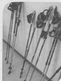
ノルディックポール