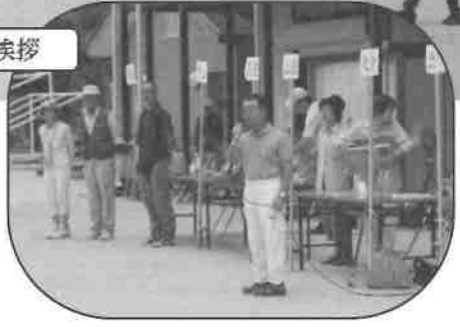
スタート前の準備体操

早朝の準備段階では小雨がパラつき・・・しかし天気予報どおり雨は上がり、蒸し暑いながらも薄日も出てこの季節にはグラウンドゴルフ日和になりました。体育部会メンバー胸をなでおろしました。