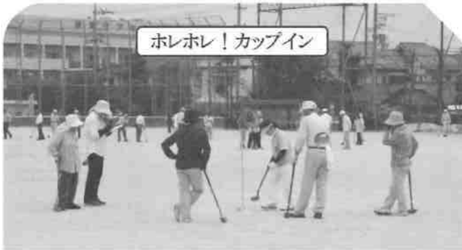
ホレホレ! カップイン