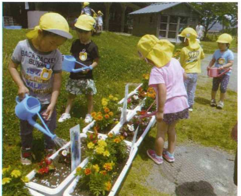
大きく 大きく 大きくなあれ (山東幼稚園で)

ンターに花が定植できました。山東幼稚園からは、会員の皆さまには優しく丁寧に花の植え方や水と肥料の大切さを教えていただき、人の温もりに触れ、園児たちが何よりの貴重な体験ができましたと感謝されました。また、園児一人一人にプラ