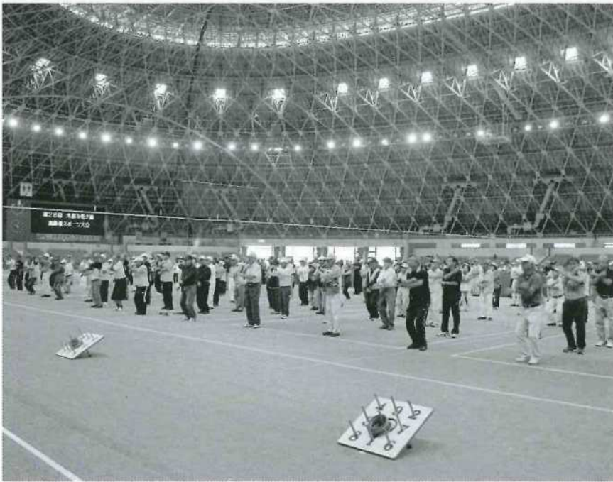
みんなそろって準備体操

む事となりました。過去にもワナゲやペタンクは常日頃練習をしないので馴染みが薄く、出場依頼しても「やっとな事が無いからダメ」との声を耳にした事が有りました。巷でもそんなに練習されてる事を聞かない種目なので、こんな機会に新しい？種目を体験してみるのが良いんじゃないかな？と思うのは私だけでしょうか。皆さんの参加・ご健闘・ご協力有難うございました。