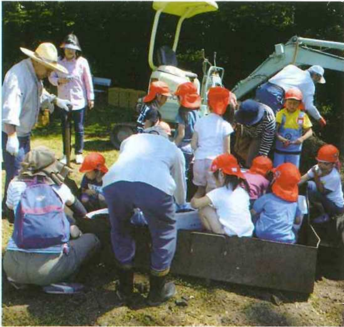
山東幼稚園児と世代交流

幸い、各単位老人クラブの会長さんのご理解とご支援をいただき、五月二十三日(水)グラウンドゴルフ大会に多くの会員方々がご参加いただき、和気あいあいと大会を盛り上げていただき、楽しいひと時がございました。山東老ク連だけでは、大会の運営は難しいですが、グラウンドゴルフ協会の全面的なバックアップのおかげです。深く感謝申し上げます。