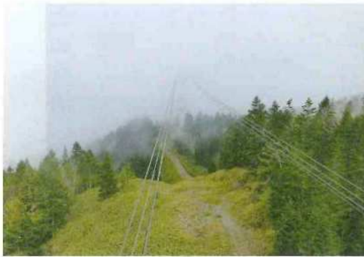
山が雲に覆われていた