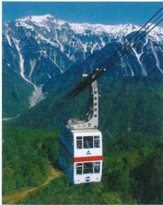
晴天であれば美しい 新緑の新穂高ロープウェイ