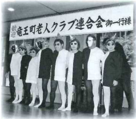
本部役員 (女性部) の踊り

二日目は、心配していた雨も奇跡的に上がり、いざ北アルプスへ。日本で唯一の二階建てロープウェイで一気の新穂高の山頂までいき、展望台からはまだ残雪がある西穂高岳、槍ヶ岳、焼岳などを眺めることができました。雲がなければ雄大な山々の景色が楽しめたと思います。旅行の目玉であるロープウェイは定員百二十一名で乗車時間は約七分。高低差は八四五メートルあり、乗り心地は思った以上に空中散歩感が強く、途中の三つの鉄塔を超えるたびにフワフワと大きく揺れ、ゴンドラ内で歓声が上がりました。まるでテーマパークのアトラクションのようにワクワク&ドキドキです。