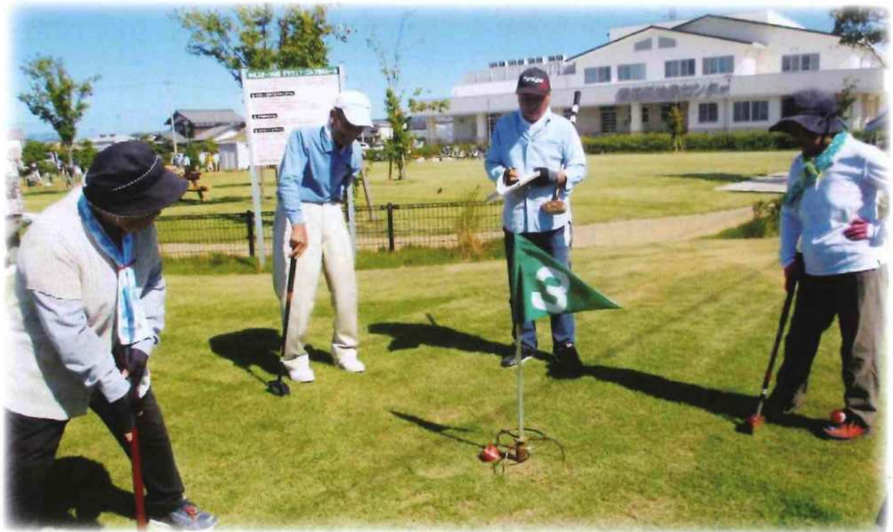
第34回グラウンドゴルフ大会

〒529-1313 滋賀県愛知郡愛荘町市731 福祉センター「愛の郷」内 ☎0749-42-7757