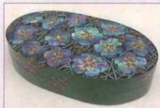
香合 「ネモフィラ」 2021年

1981年生まれ。愛知県の東邦高等学校美術科で日本画科を専攻し、日本画家を志して勉強する中、日本の伝統工芸の技術を学びたい気持ちが芽生え、京都の伝統工芸を教える学校で「蒔絵」と出会う。そして自分の表現方法を蒔絵を主に漆芸という技法を学び、現在滋賀県草津市の自宅兼工房で作品制作を行っている。