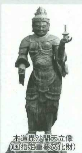
木造毘沙門天立像 (国指定重要文化財)

毘沙門天は、須弥壇の四方に安置される四天王の一つで、多聞天のことである。福德と富貴の天としても信仰され、後には七福神の一つに数えられている。本像は、薬師堂が毘沙門堂と