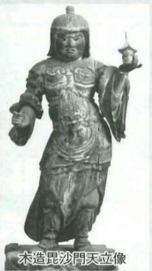
木造毘沙門天立像

これらの3体の仏像は、木川町内の天神社に本地仏として祀られていたが、明治初年の神仏分離により、毘沙門堂(今の薬師堂)に移されたと考えられている。