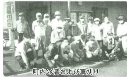
町内の溝および草刈り