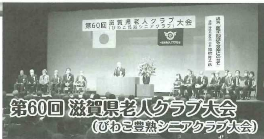
第60回 滋賀県老人クラブ大会 (びわこ豊熟シニアクラブ大会)