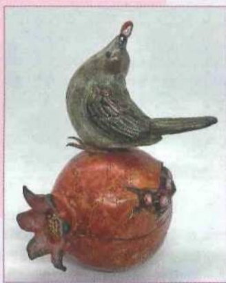
香合 「柘榴に雀」 2020年

《自由な発想》《広い視野》《独自の感性》で物事を解釈し、観る人・使う人と共に楽しむことができるような作品づくりをしていきたいと思っています。