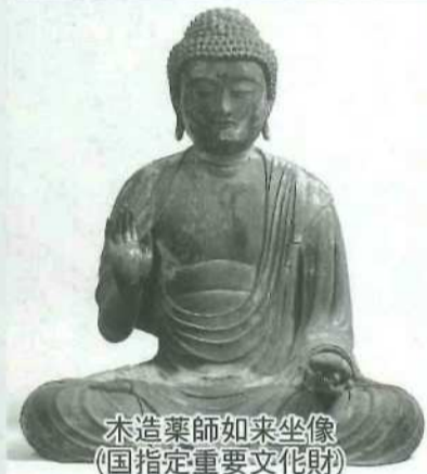
木造薬師如来坐像 (国指定重要文化財)