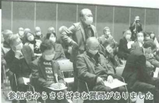
参加者からさまざまな質問がありました

最後の質問コーナ ーでは、参加者からの胃 腸器官や就寝時の喉の 渇きについての悩みに アドバイスを送るなど、 音楽を楽しみながら知 識が身に付く、大いに 意義のある講演会とな りました。