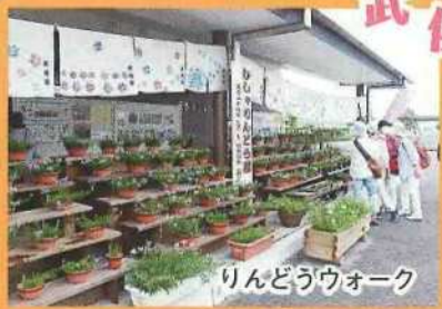
りんどうウォーク