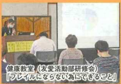
健康教室(友愛活動部研修会) 「フレイルにならない為にできること」