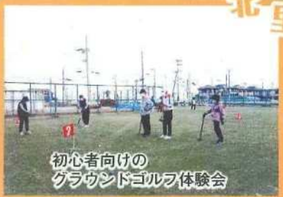
初心者向けの グラウンドゴルフ体験会