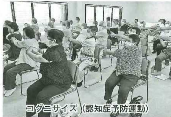
ヨガミサイズ (認知症予防運動)

岡山学区老人クラブ連合会では本年一月に全会員対象に、老人クラブの運営、活動の現状評価と活性化に向けた提言等についてアンケートを実施、四五九人の皆様より回答を得ました。また、自由記述の意見も六十八件寄せられ、今後の活動活性化取り組みを検討、推進する上で大変有益なものとなりました。調査結果を踏まえての課題と対策を整理し、コロナ禍でも実施できる施策より