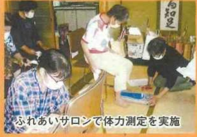
ふれあいサロンで体力測定を実施