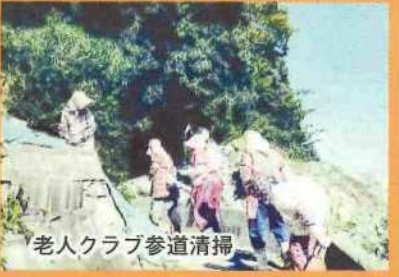
老人クラブ参道清掃