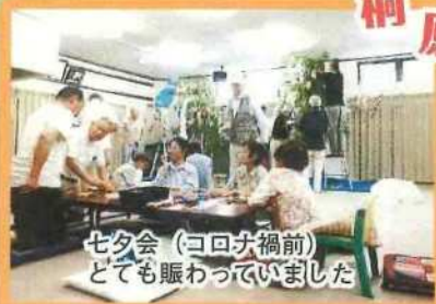
七夕会(コロナ禍前) とても賑わっていました