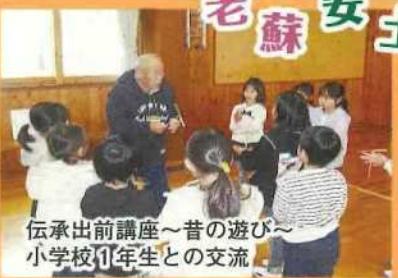
伝承出前講座～昔の遊び～ 小学校1年生との交流