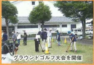
グラウンドゴルフ大会を開催