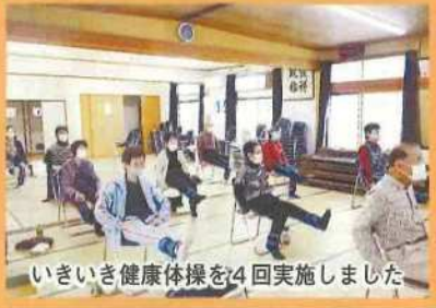
いきいき健康体操を4回実施しました