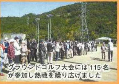
グラウンドゴルフ大会には115名 が参加し熱戦を繰り広げました