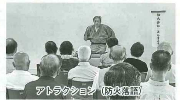
アトラクション (防火落語)