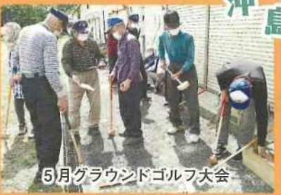
5月グラウンドゴルフ大会