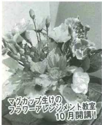
マグカップ生けのフラワーアレンジメント教室10月開講!

岡山学区老人クラブ連合会では本年一月に全会員対象に、老人クラブの運営、活動の現状評価と活性化に向けた提言等についてアンケートを実施、四五九人の皆様より回答を得ました。また、自由記述の意見も六十八件寄せられ、今後の活動活性化取り組みを検討、推進する上で大変有益なものとなりました。調査結果を踏まえての課題と対策を整理し、コロナ禍でも実施できる施策より