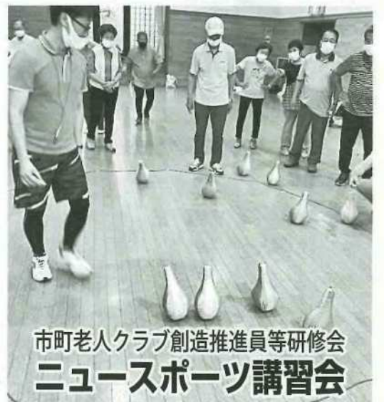
市町老人クラブ創造推進員等研修会 ニュースポーツ講習会

門と、陣地外床面に落ちた自分チームの玉を拾う専門の人がいます。②ガラッキー 二つのチームに分かれてダーマ(大きめのボウリングのピンみたいな起き上がりこぼし)を