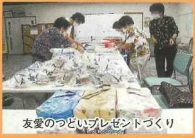
友愛のつどいプレゼントづくり