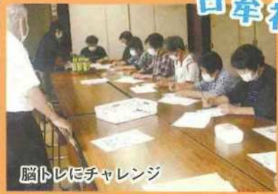
脳トレにチャレンジ