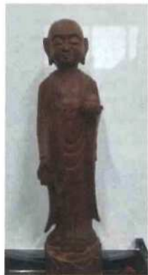
お地藏さま 山崎 豊彦(大中小路)