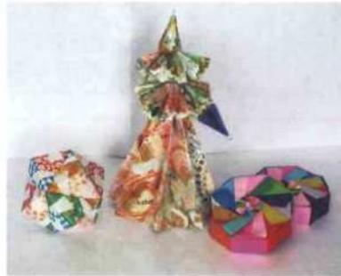
折り紙 福谷 富士子(下町)