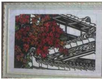
もみじ 大堀 スエ子(入町)