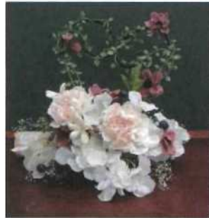
アーティシャルフラワー 森 正江(辻町)