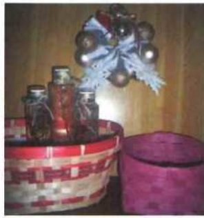
クリスマスリース ハーバリウム ペーパークラフト 岡野 公子(竹生)