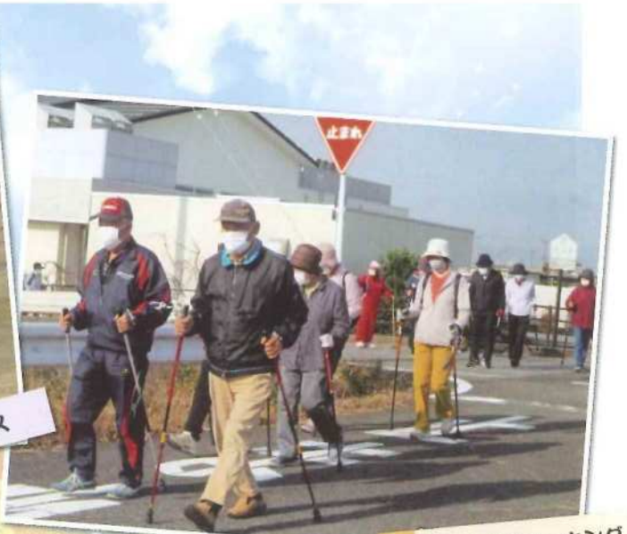
さわやかウォーキング