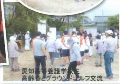
愛知高等養護学校生 高齢者とグラウンドゴルフ交流