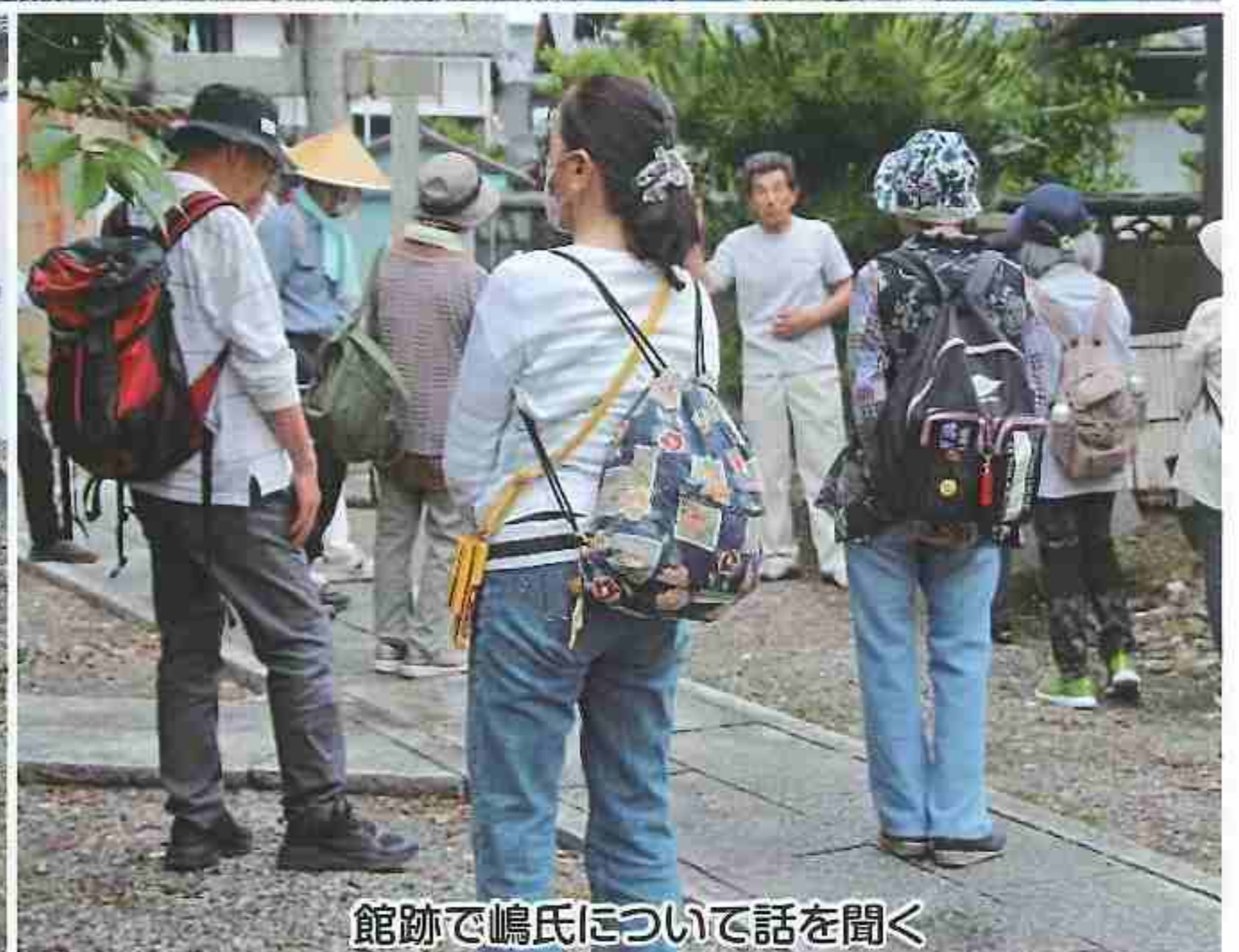
館跡で嶋氏について話を聞く