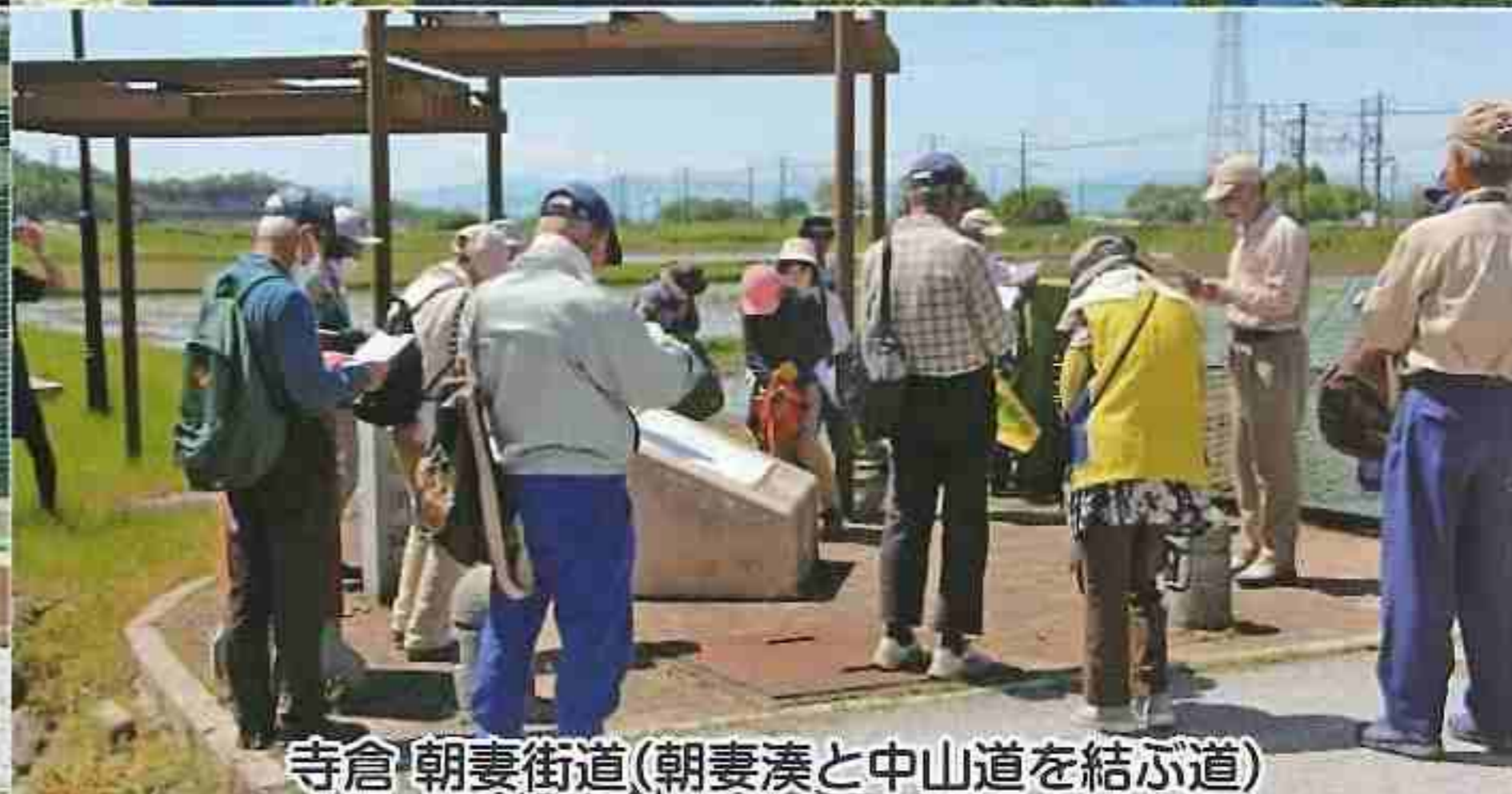
寺倉 朝妻街道(朝妻湊と中山道を結ぶ道)