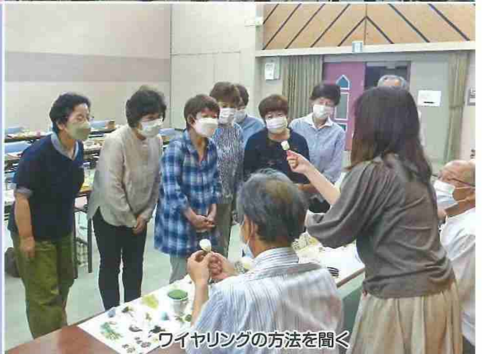
ワイヤリングの方法を聞く