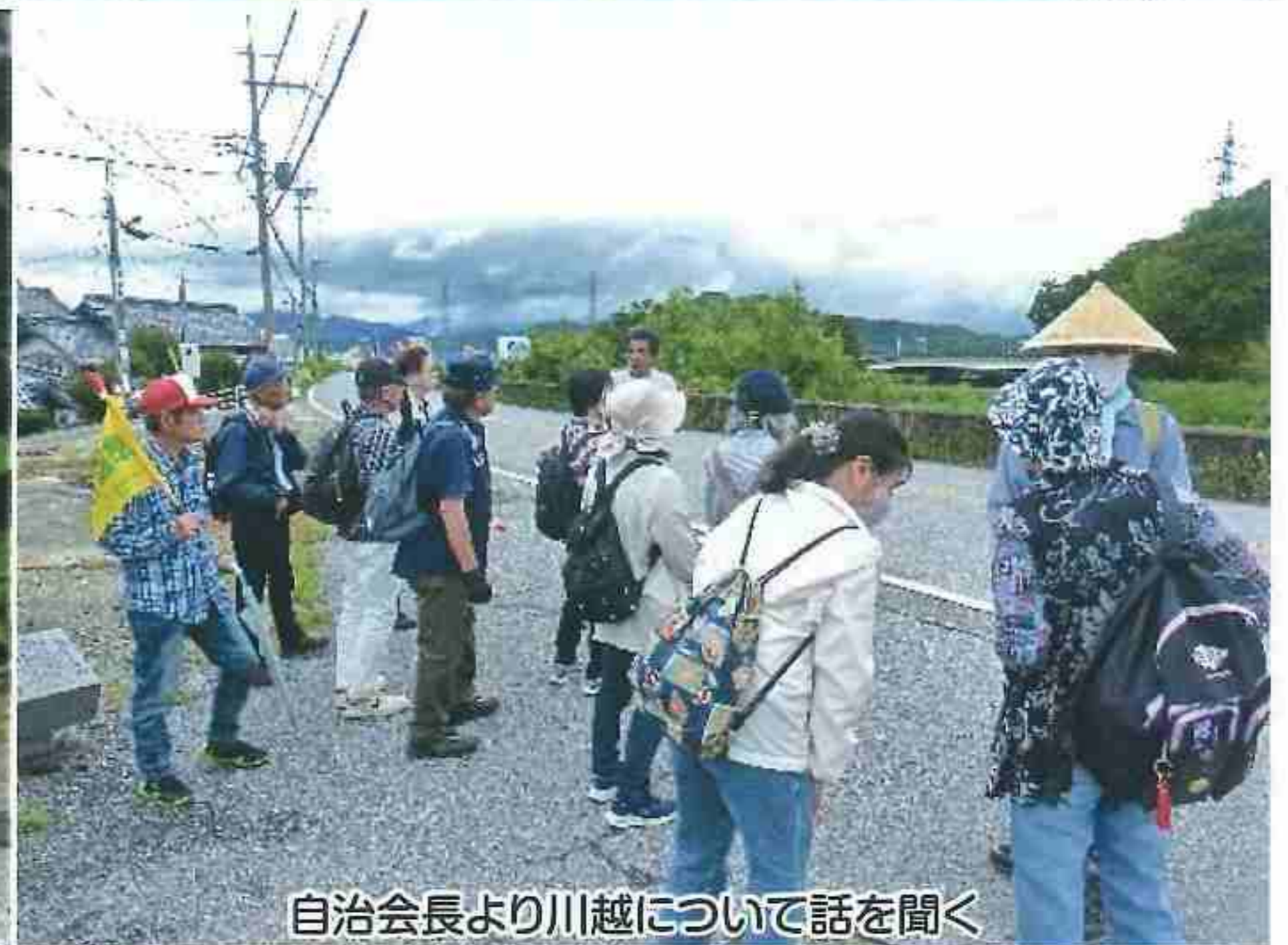
自治会長より川越について話を聞く

各自治会館ではトイレ休憩とさせていただきました。 又、飯自治会長には現地で説明頂きました。 ありがとうございました。