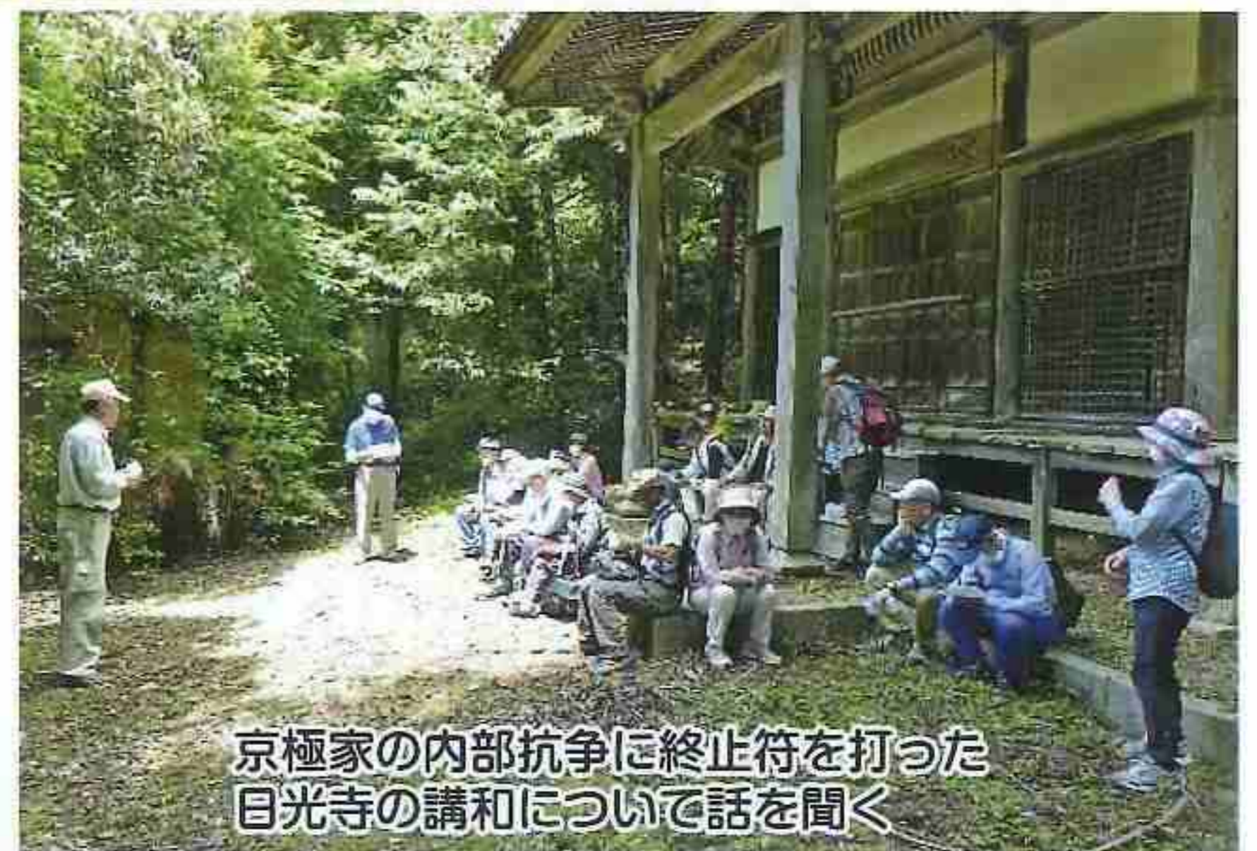
京極家の内部抗争に終止符を打った日光寺の講和について話を聞く