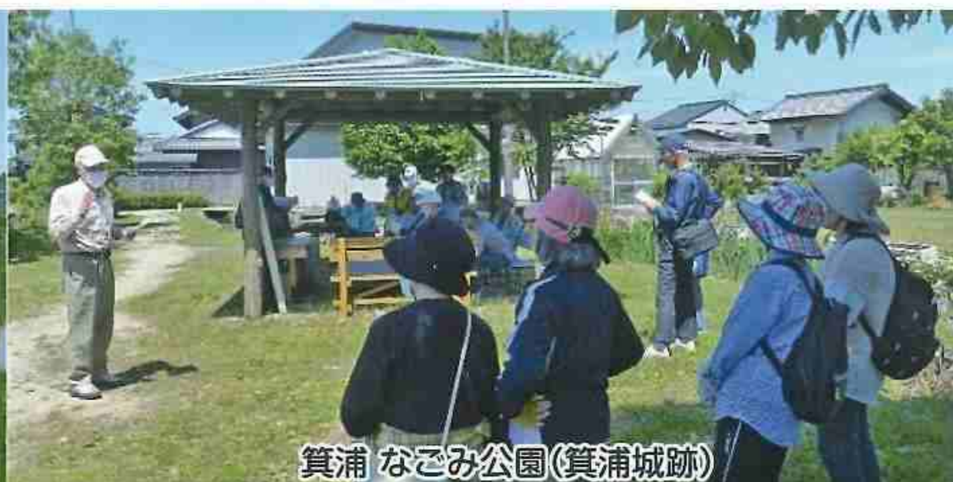
箕浦 なごみ公園(箕浦城跡)