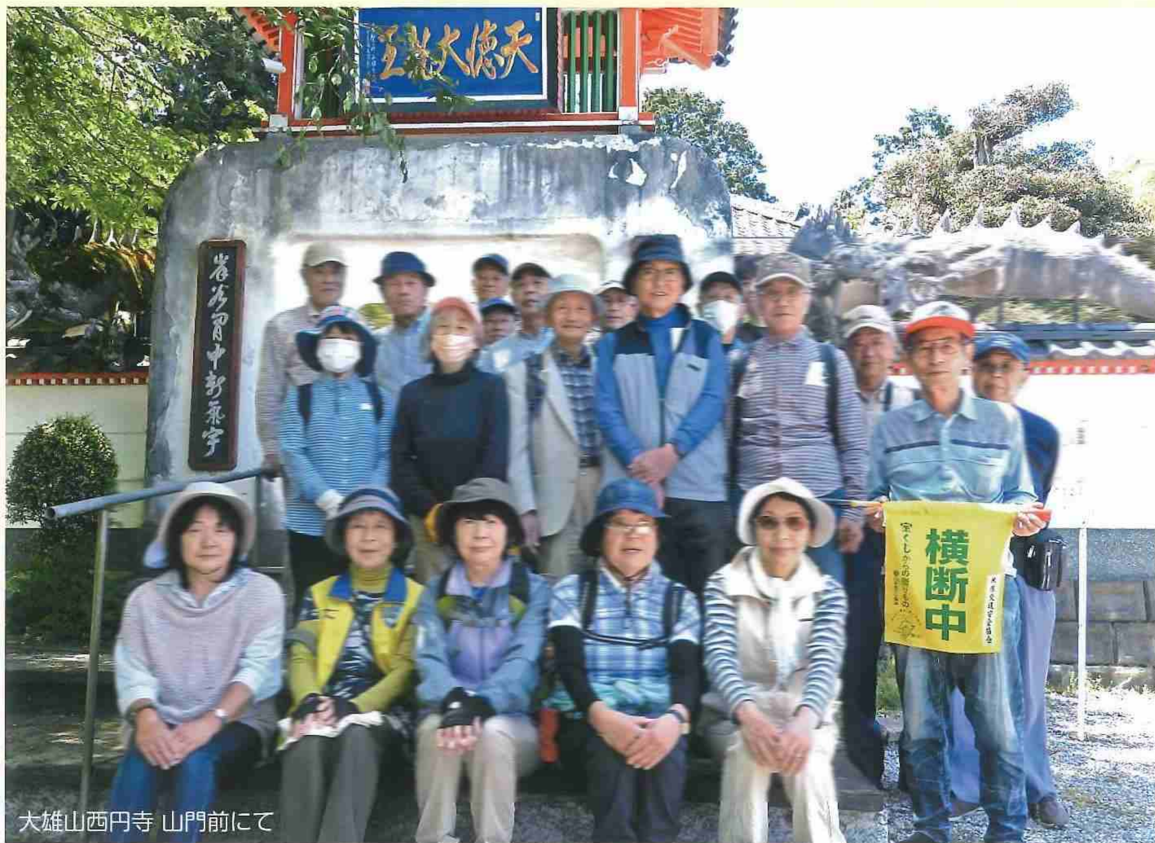
大雄山西円寺 山門前にて