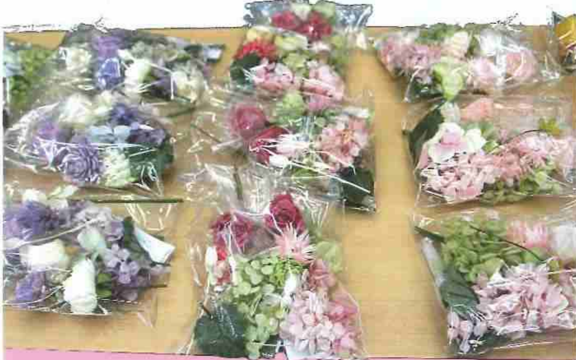
カラーバリエーションや花の種類が豊富