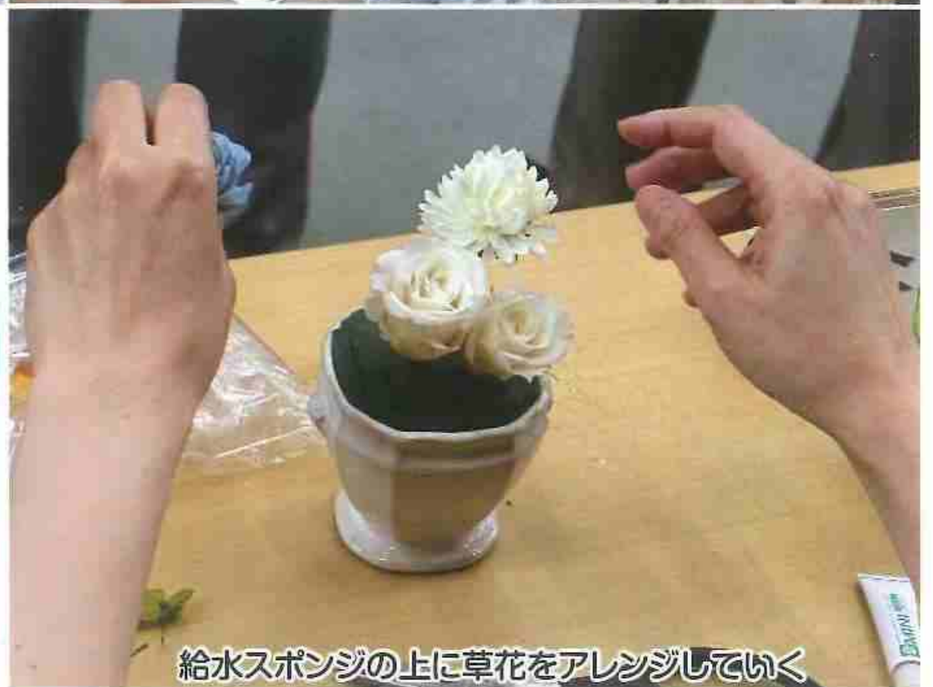
給水スポンジの上に草花をアレンジしていく