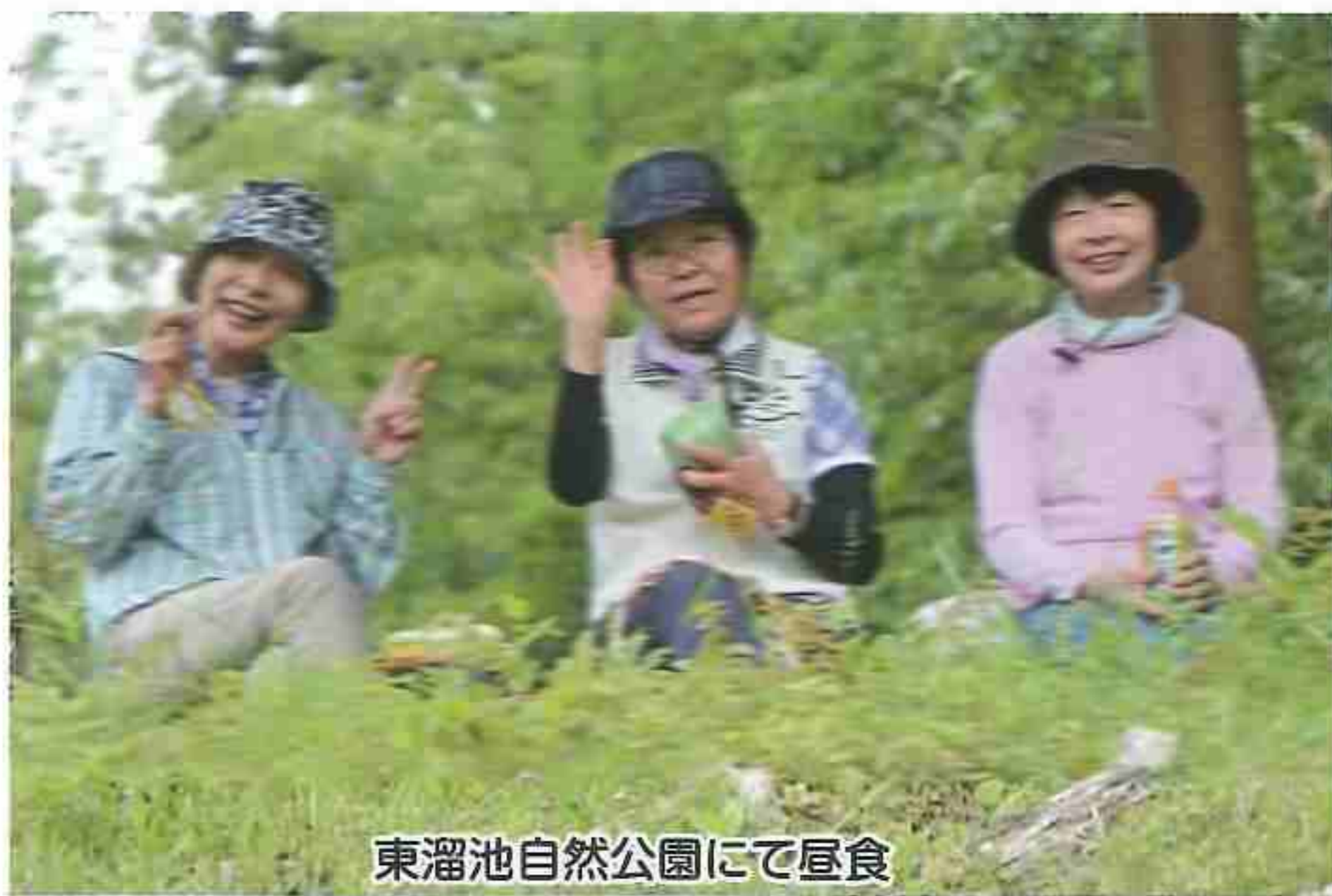
東溜池自然公園にて昼食