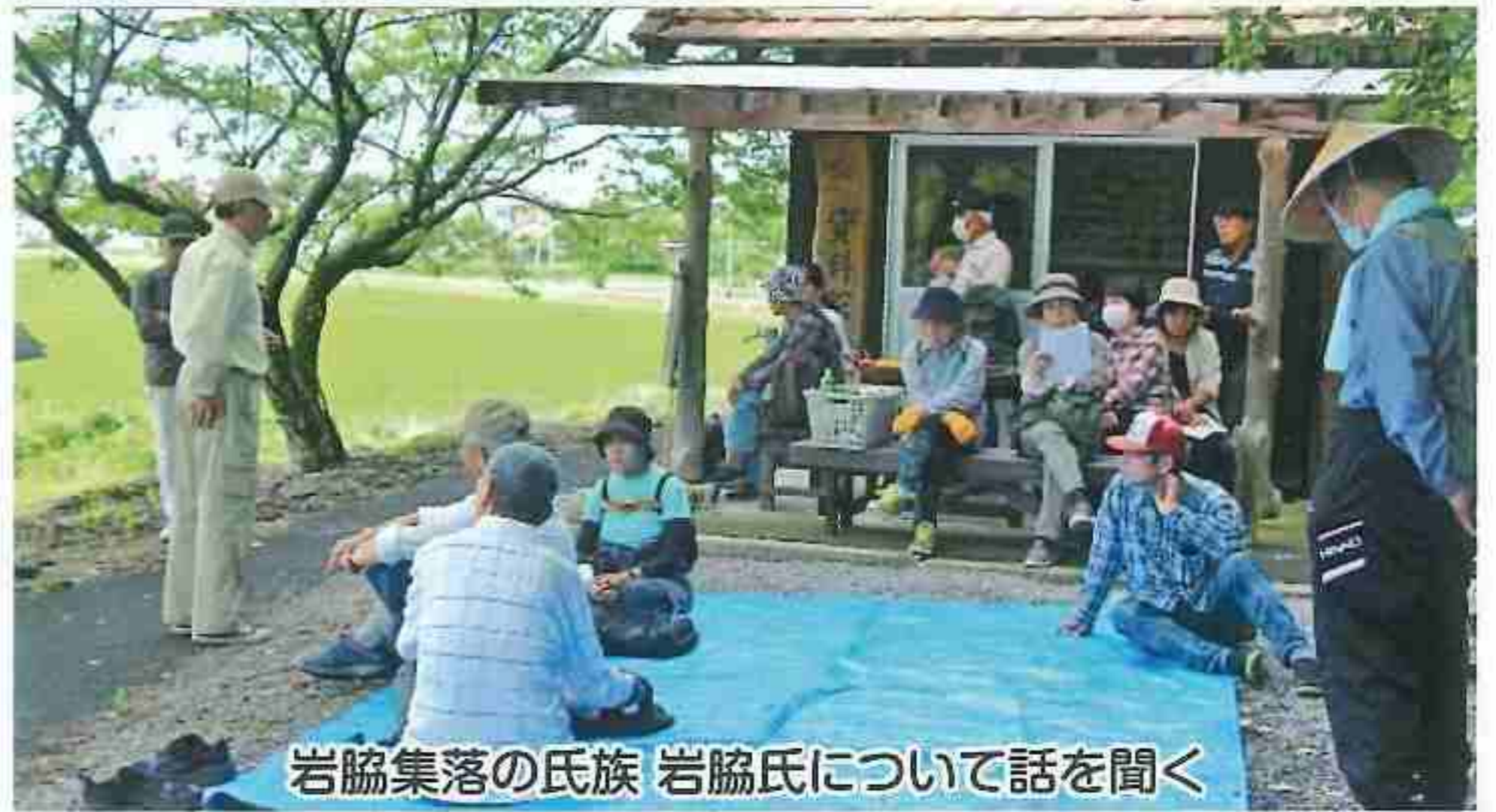
岩脇集落の氏族 岩脇氏について話を聞く