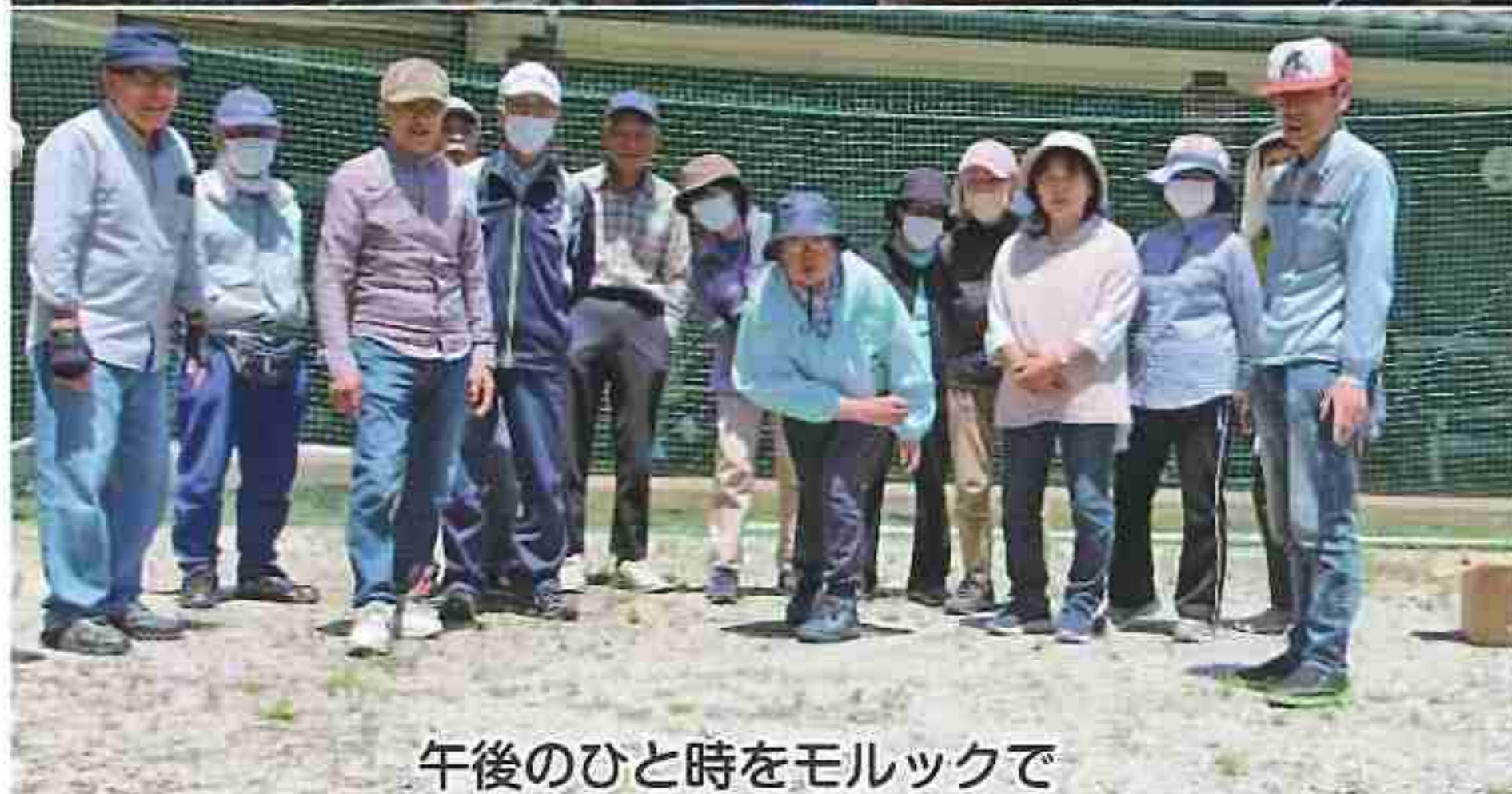
午後のひと時をモルックで