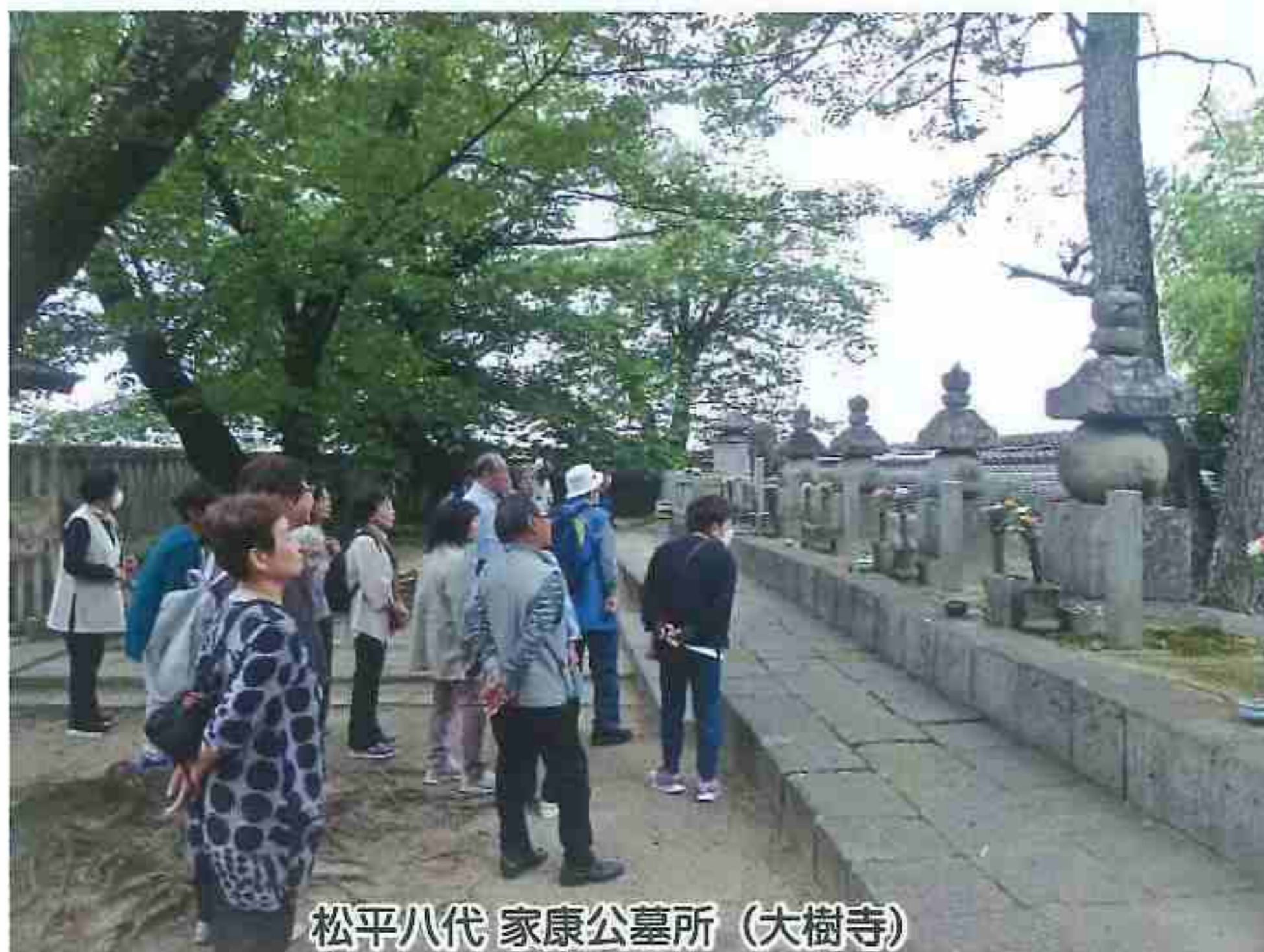
松平八代 家康公墓所 (大樹寺)