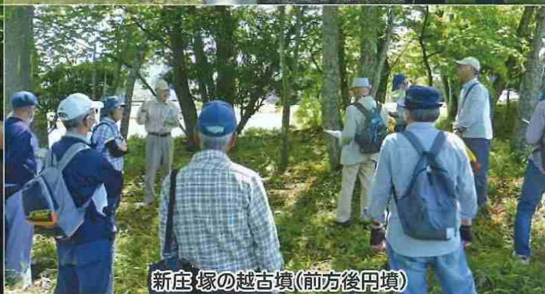
新庄 塚の越古墳(前方後円墳)