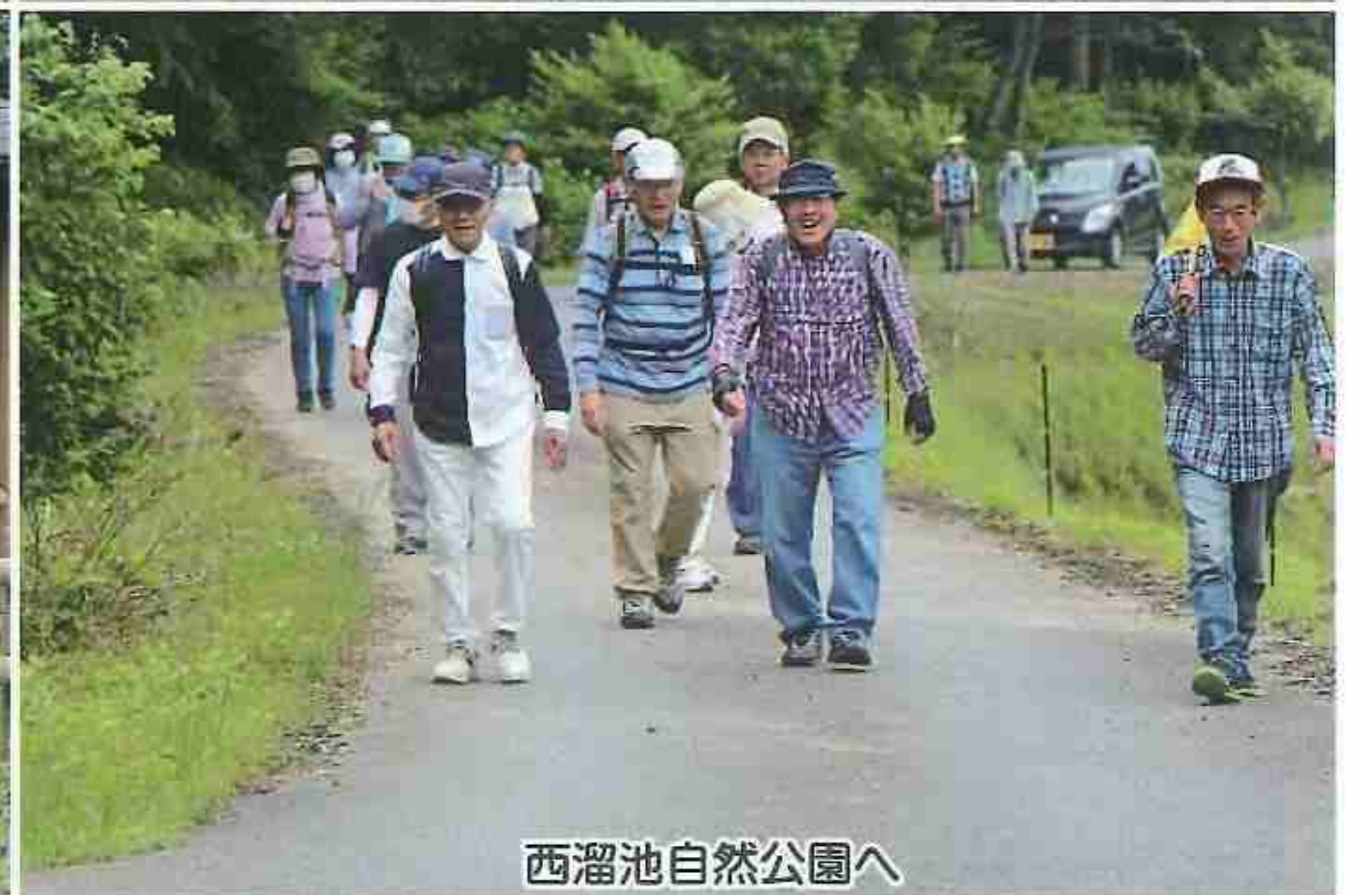
西溜池自然公園へ