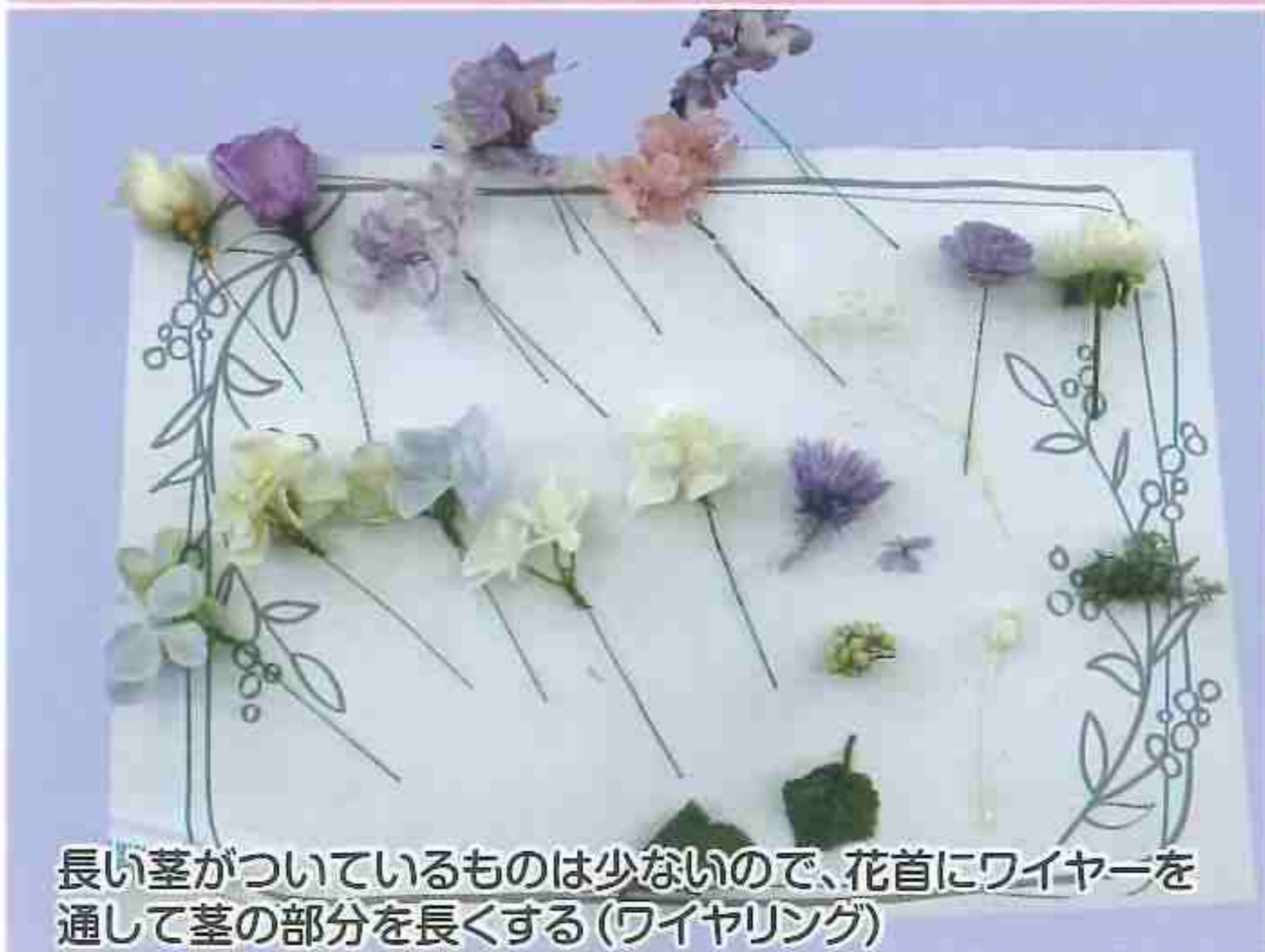
長い茎がついているものは少ないので、花首にワイヤーを通して茎の部分を長くする(ワイヤリング)