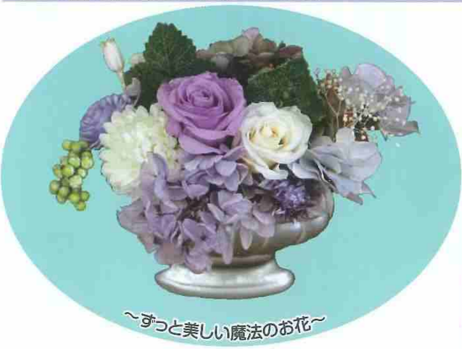
~ずっと美しい魔法のお花~