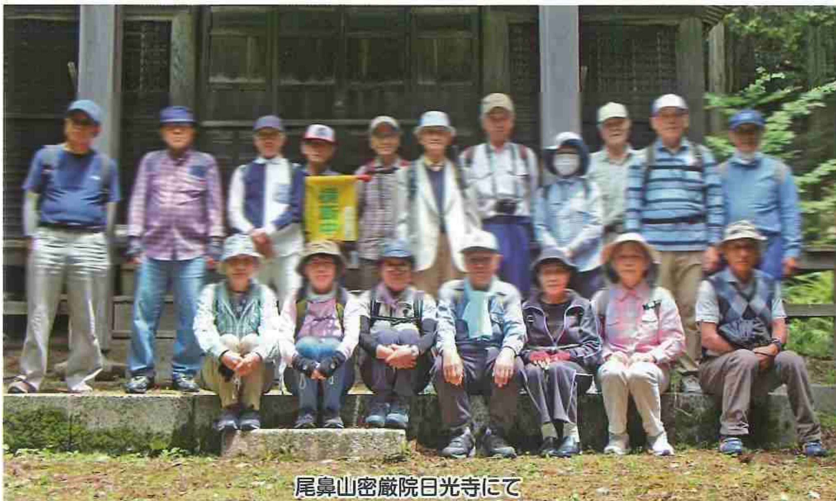
尾鼻山密厳院日光寺にて

5月31日、19・6度72%曇り。 午前10時、あいにくの曇り空でしたが19名が やすらぎハウスを出発。経由地は東溜池・西溜 池自然公園と日光寺。高居氏より歴史的な説明 がありました。