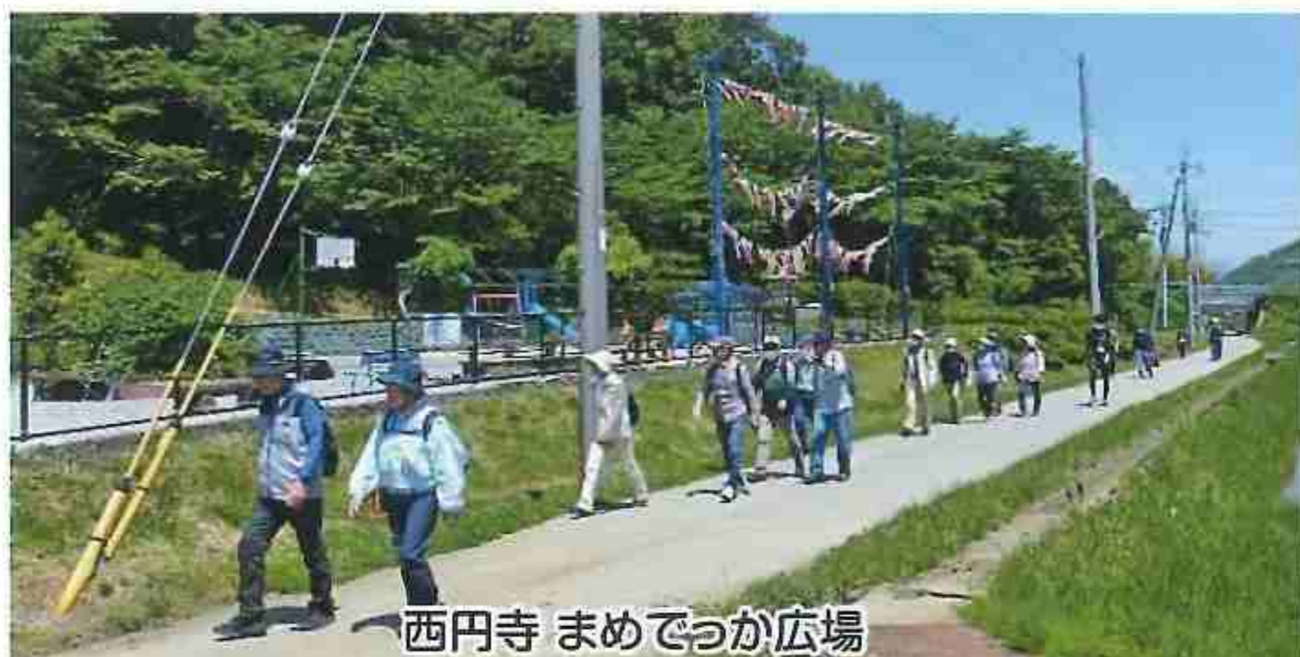
西円寺 まめでっか広場