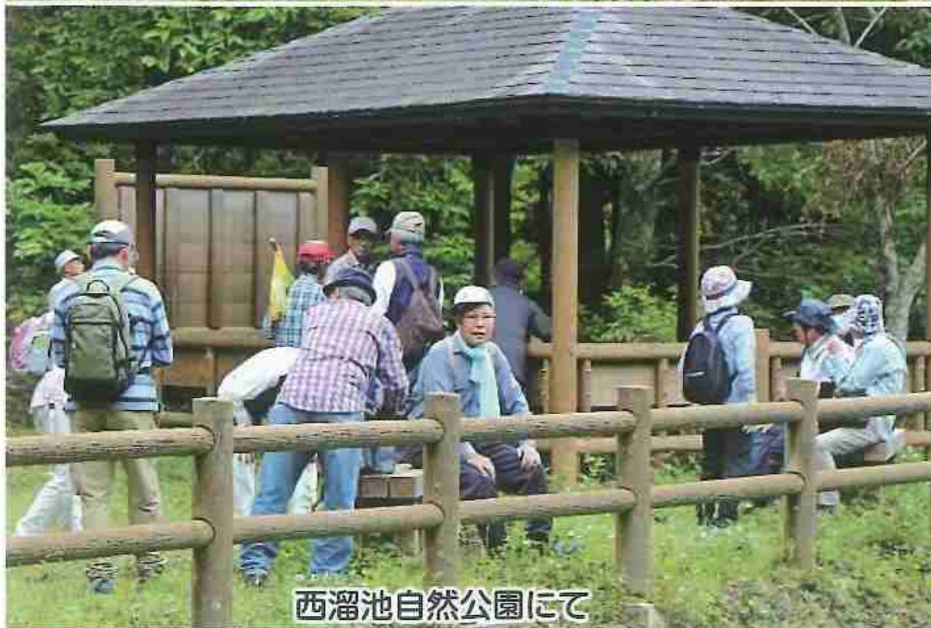
西溜池自然公園にて