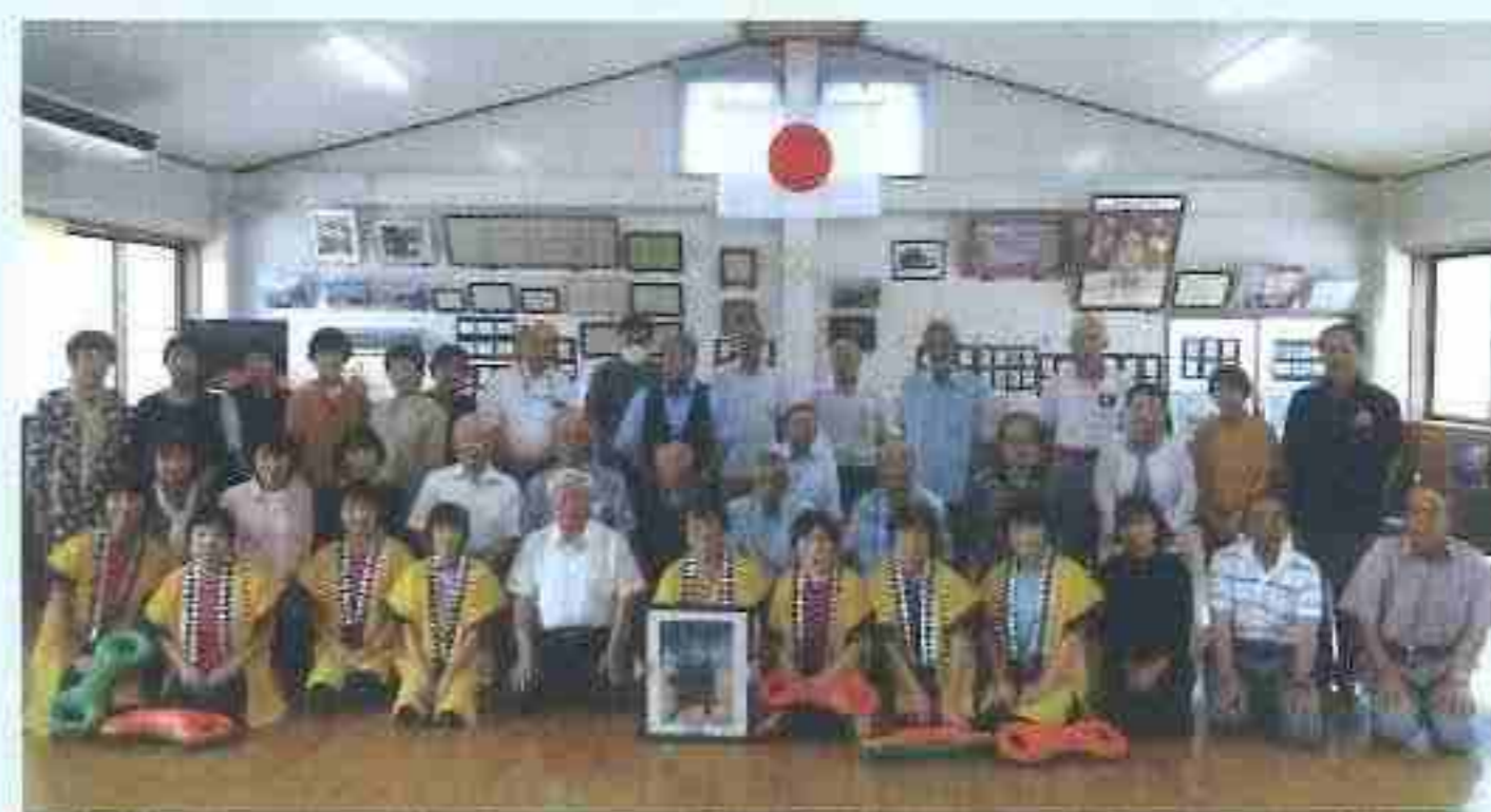
3Bビーナスの会の皆さんと陽夫多神社参集所にて

3Bビーナスの会/活動人員20名(男性7名・女性13名) 最高齢者82歳・最若手会員63歳