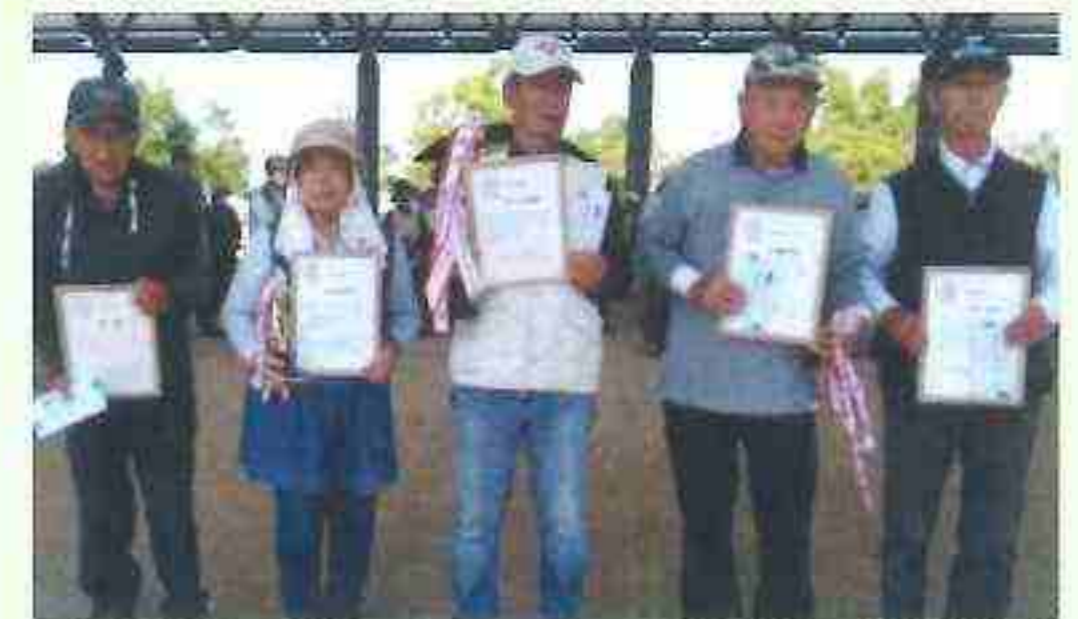
秋季大会の成績は次の通りです。