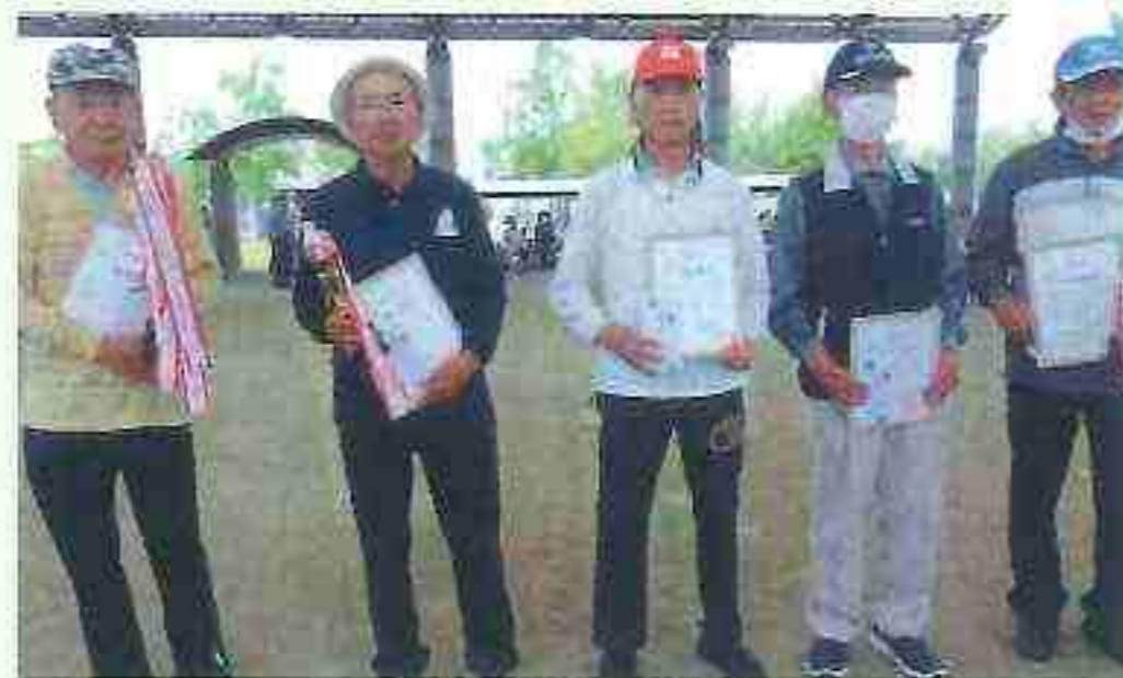
春季大会の成績は次の通りです。