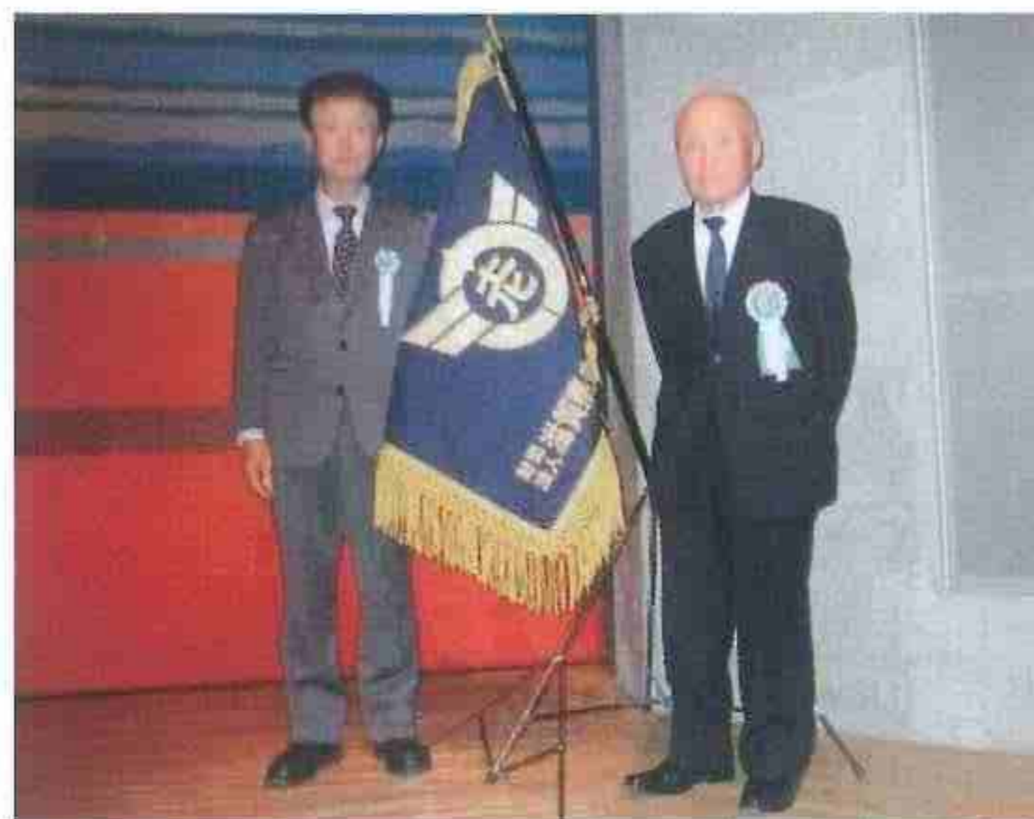
在士代表者、金屋代表者

介護篤行者賞は、病床にある高齢者・家族を長期(原則は3年以上)にわたり献身的に介護し、近隣者より称賛されている会員、他の模範となる会員様におくるものです。