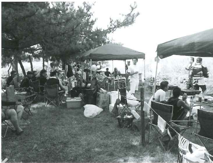
にぎわいを見せるバーベキュー