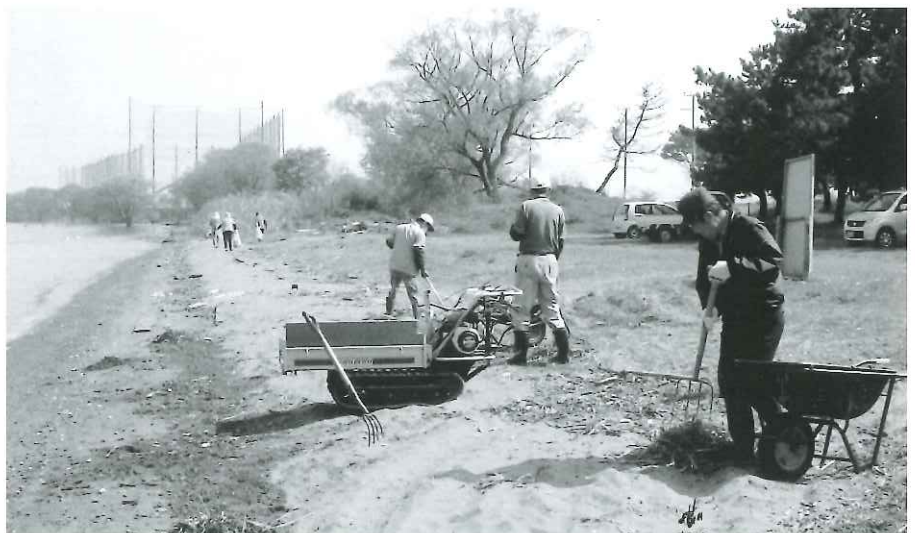
朝の湖岸清掃作業

とにかく無事終えることができ、恒例の反 省会は79名の参加で盛り上がりました。今後