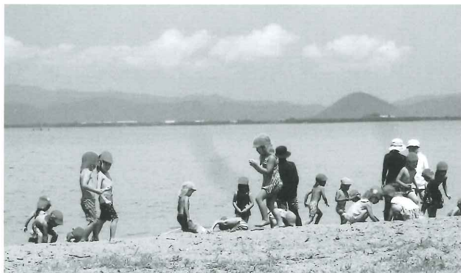
琵琶湖に響く子どもたちの歓声

特に当クラブならではの取り組みとして、地域内に「神明キャンプ場」を開設して運営管理をしていますので、その活動についてご