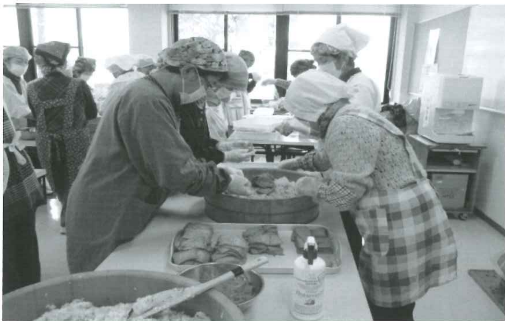
友愛訪問でのいなり寿司作り