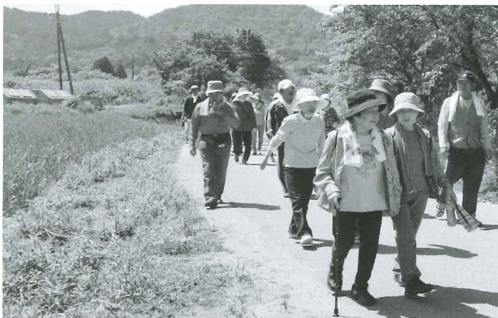
篠原地区での健康ウォーキング

ある地域では、クラブの会長が会員を増やすことに前向きでなく、好きなもの同士の寄り合いになっていることを、熱心な自治会長が心配しておられました。そこで、この自治会長と接触を続けたところ、自治会長を辞めた後は自らクラブの会長となって『井の中の蛙』状態から脱し、地域の発展につながるようなクラブにしていくと約束いただきました。