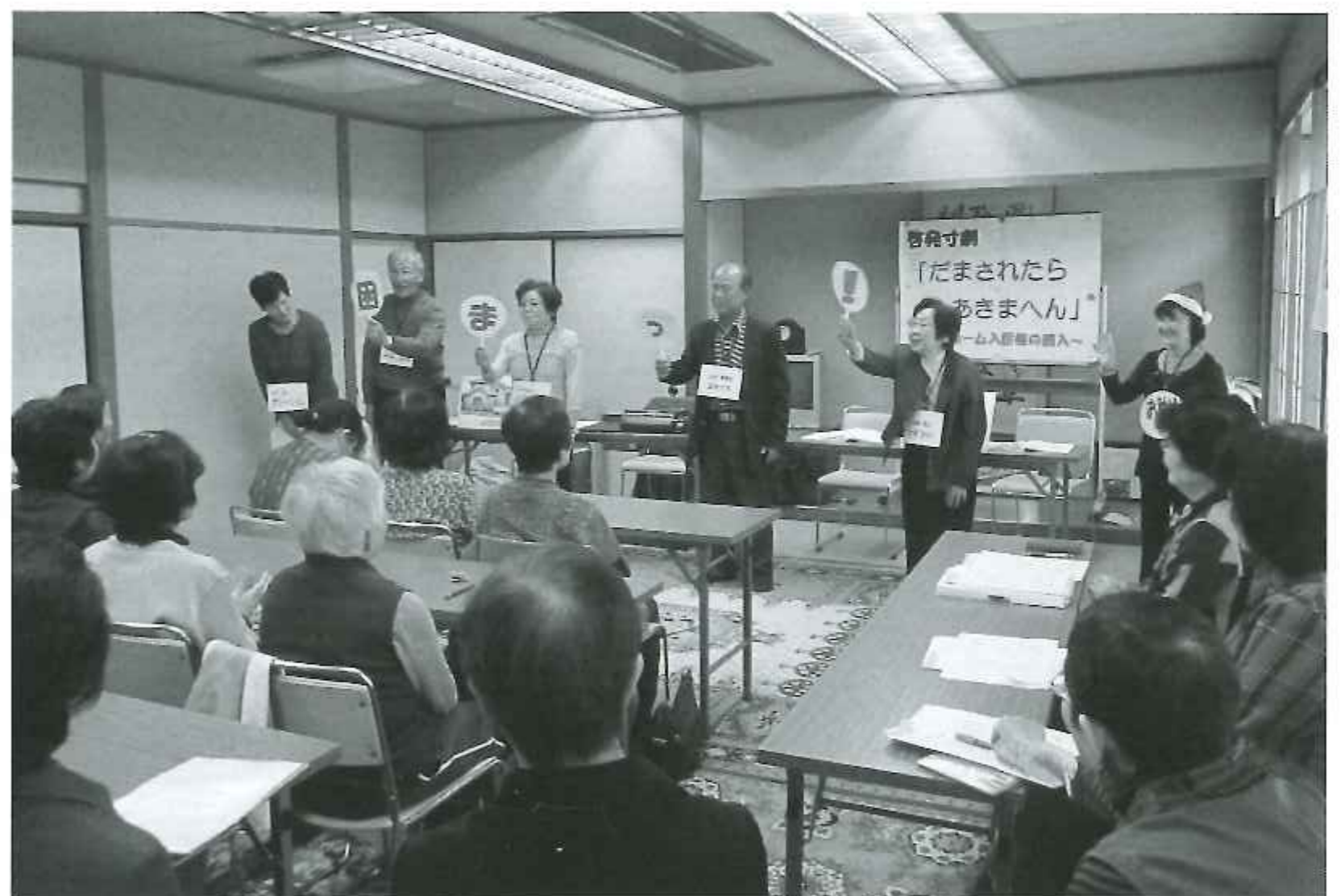
詐欺被害防止の寸劇

誕生しました。きっかけは、まず女性役員が自治会役員宅を訪問して、クラブ立ち上げの勧めを再三行いました。その後、役員・事務局が一体となって、会報や各種案内を持参して積極的に呼びかけ続けた結果、83人のクラブが誕生したものです。ちなみに会長は女性です。