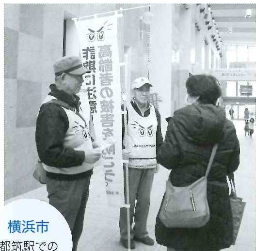
横浜市 都筑駅での 啓発活動

都築区老連では、日頃友愛活動員として活躍している31名にお願いして「見守りサポーター養成講座」を受講していただきました。受講後は、友愛活動での訪問時の見守りや声かけに加えて、必ず詐欺被害防止の話題提供に努めるようにしています。またサロンに集まる方々にも同じように情報提供しています。今年2月には、警察、防犯協会、区老連役員とともに新たにサポーターも加わり、駅