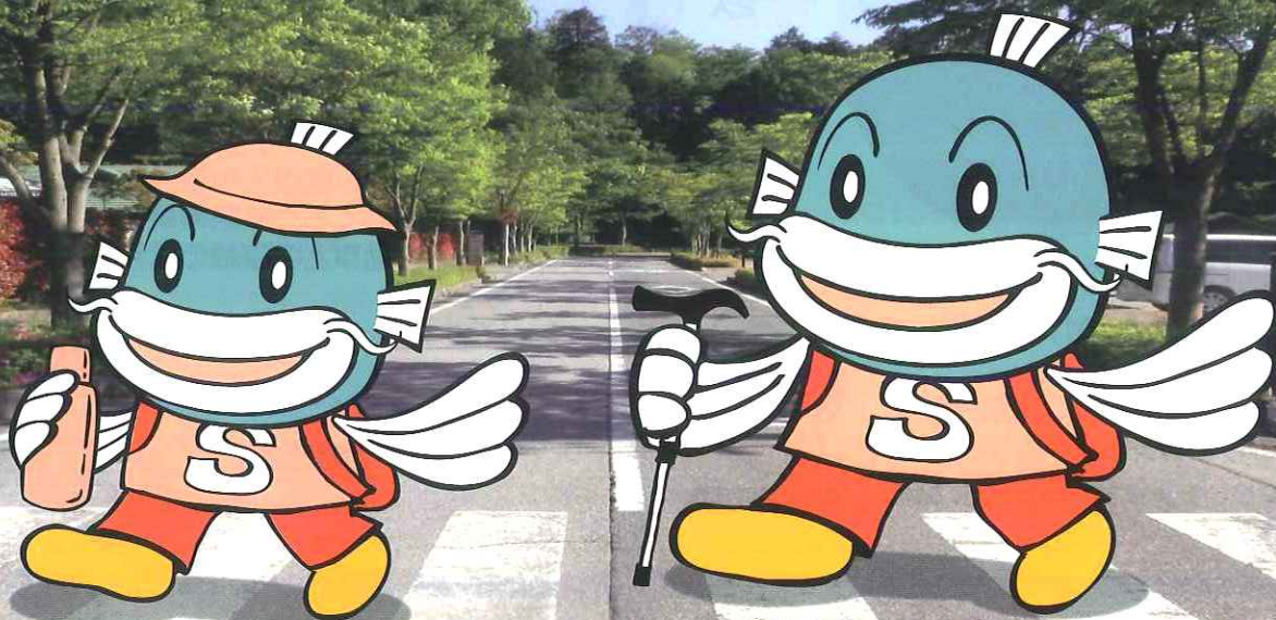
滋賀県イメージキャラクター キャップフィー